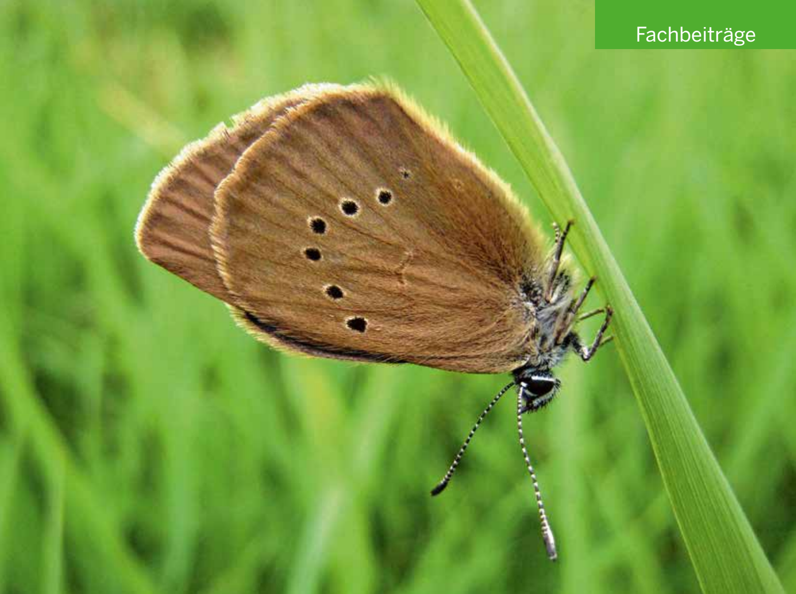
Abb. 1: Der Dunkle Wiesenknopf-Ameisenbläuling, ein gefährdeter Spezialist im Rurtal.