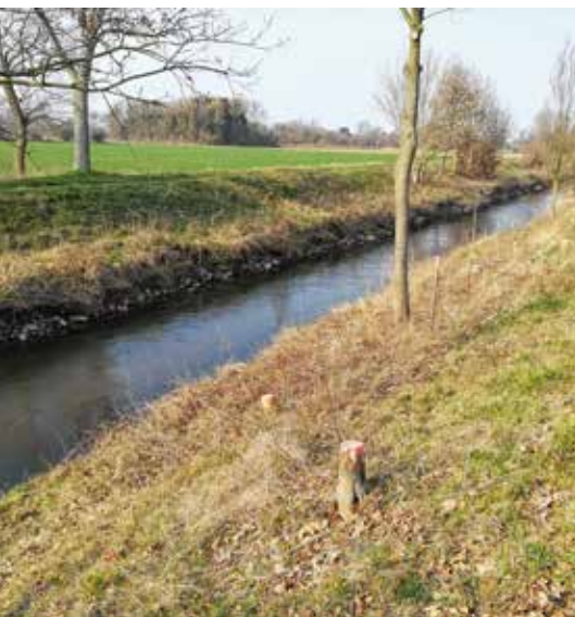
Abb. 3: Rückschnitt von Gebüsch im Kernfluggebiet des Dunklen Ameisenbläulings durch den Wasserverband Eifel-Rur.

August und kriechen aus dem Ameisen-nest (Lepiforum, Settele et al. 2009, Wynhoff et al. 2008).