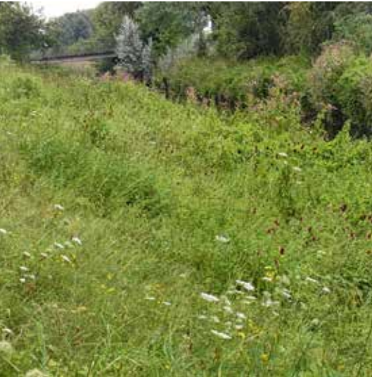
Abb. 2: Lebensraum des Dunklen Wiesenknopf-Ameisenbläulings im Kreis Heinsberg (oben) und in der Gemeinde Roerdalen (unten).