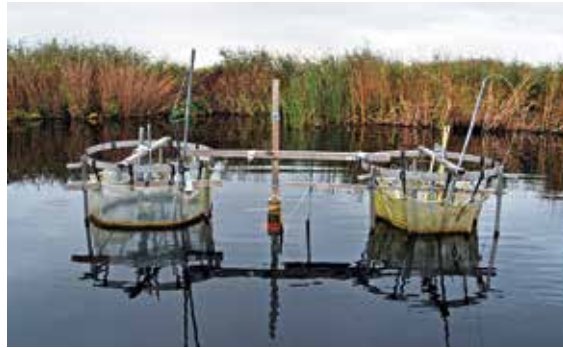
Figuur 3 Twee representatieve enclosures in het veldexperiment naar de effecten van verbrakking in het Ilperveld, links met controlebehandeling, rechts met de hoogste zoutbehandeling. Het is duidelijk te zien dat de inhoud van de rechter enclosure is afgenomen.

Uit het in dit artikel gepresenteerde onderzoek blijkt dat verbrakking grote gevolgen heeft voor de oppervlaktewater- en waterbodemkwaliteit, terwijl veel van de vooraf verwachte negatieve gevolgen, zoals een verhoogde veenafbraak en eutrofiëring, uitblijven. Verbrakking blijkt zelfs te leiden tot een verlaagde fosfaatbeschikbaarheid en een sterk verlaagde methaanemissie. Na verbrakking kan weer een milieu ontstaan waarin soor-