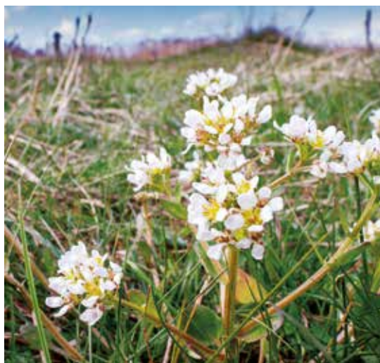
Figure 4 English Scurvygrass ( Cochlearia officinalis subsp. anglica ).